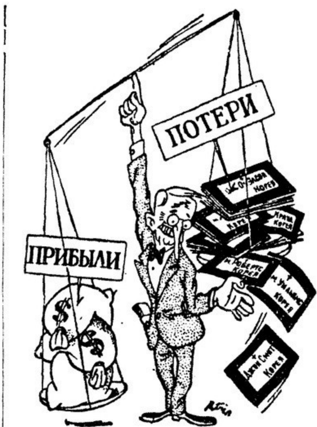
ТРУМЭН — Как видите, господа, наша весов продолжает склоняться в нашу пользу... Рисунок из чехословацкой газеты «Лидове новины»

В 1920 году Иван Ольбрахт посещает Советский Союз. Результатом этой поездки была его книга «Очерки о современной России», в которой он показывает, как