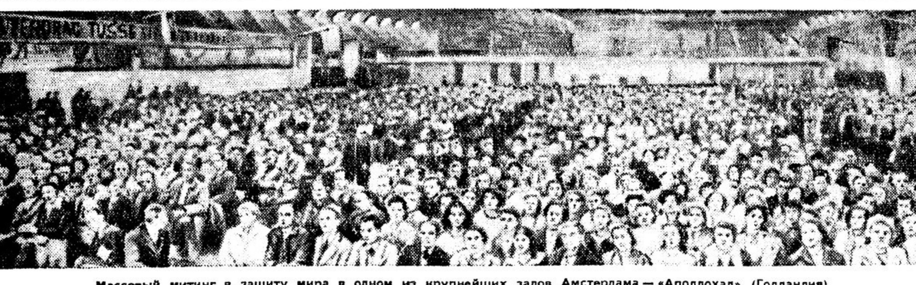
Массовый митинг в защиту мира в одном из крупнейших залов Амстердама — «Аполлохал» (Голландия)